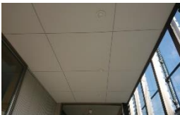
ケイ酸カルシウム板