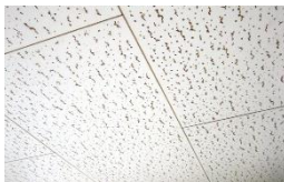
石膏ボード・ジプトン