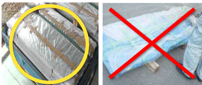
二重梱包し目地はテープ止め