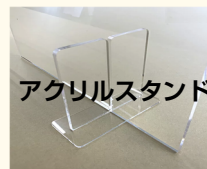
アクリルスタンド

アクリル製またはプラスチック製のスタンドは、事前に取り外し、アクリル板のみを排出して下さい。